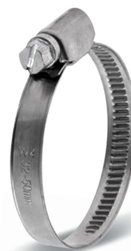
DGC 9 mm - W4