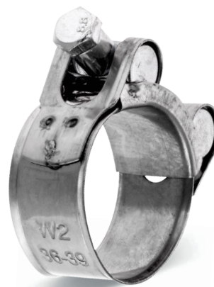
GBS SILVER - W2