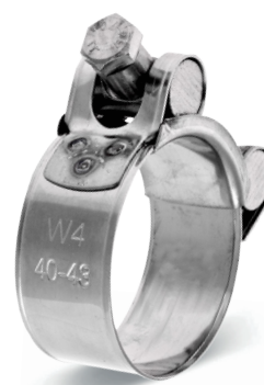
GBS SILVER - W4