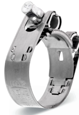
GBS M NORMA - W1/W2/W4/W5