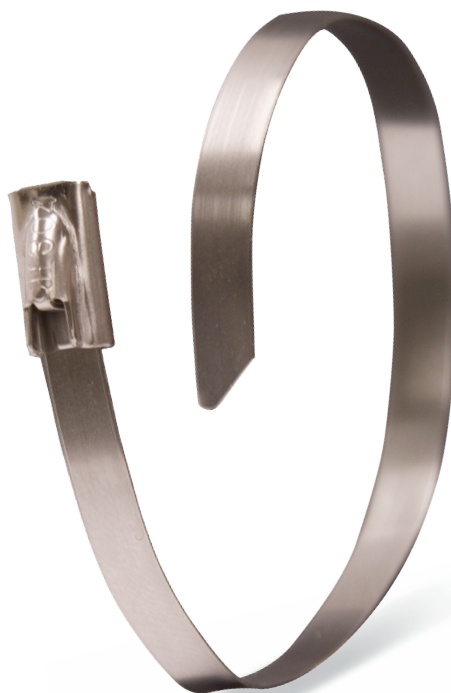
KULKOWE BALL LOCK - W4