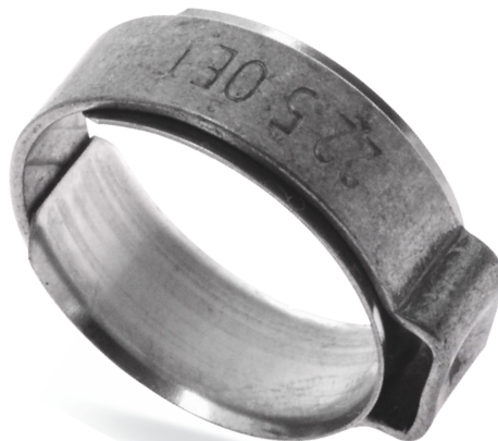
OETIKER 154 - OPASKI Z UCHEM - W4 (z pierścieniem wewnętrznym)