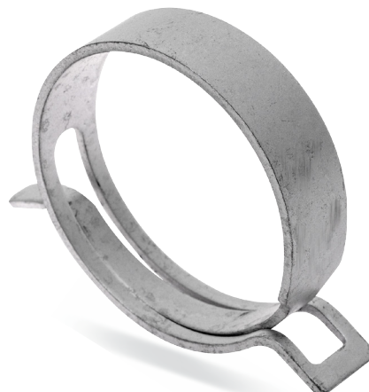
OPASKI SAMOZACISKOWE SPRĘŻYSTE - W1