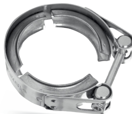
V - CLAMP - DO UKŁADU WYDECHOWEGO - W4/W5