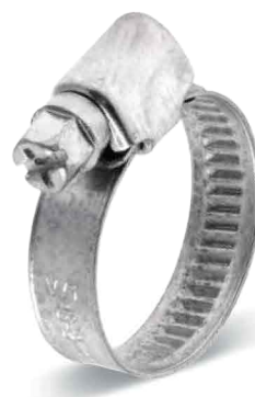
DGC 9 mm - W1