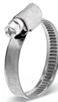
DGC 9 mm - W2