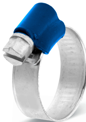
DGC STRONG 9 mm - W1