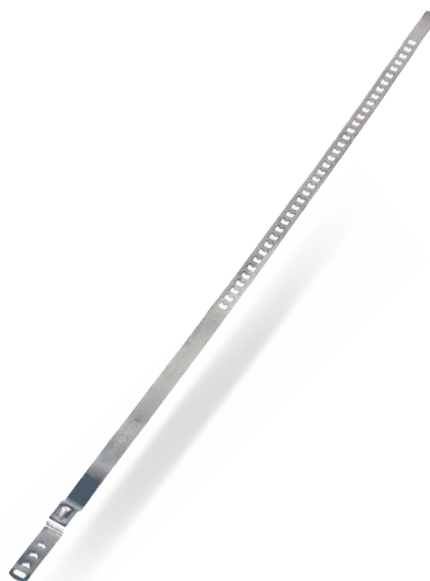
OPASKI DO PRZEGUBÓW STANDARD - W2