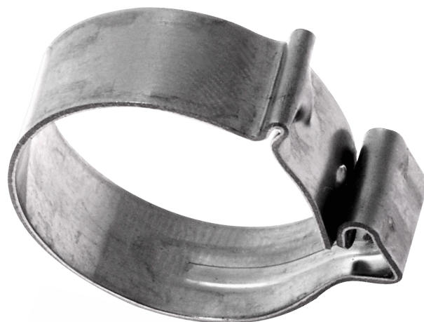
OPASKI ZATRZASKOWE TYPU CLIC - W2