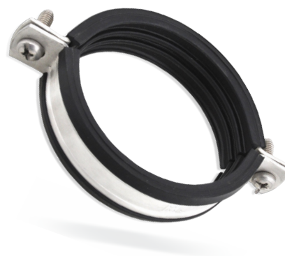
UCHWYTY DO RUR - HEAVY UNI M12/M16- W1 (do rur masywnych z okładziną EPDM)