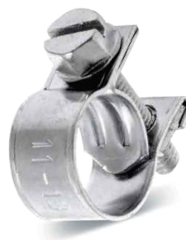
GBS MINI - W1