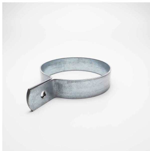
OBEJMY JEDNOCZĘŚCIOWE DO RUR SPIRO W1