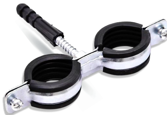
UCHWYTY DO RUR DWUŚRUBOWE PODWÓJNE M8 - W1 (z okładziną EPDM)